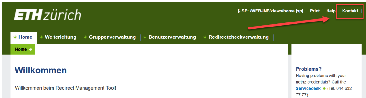
Abbildung 21: Wo das Formular zu finden ist

Sie können auch unser Formular verwenden, dies findet man in der Navigationsleiste auf der oberen rechten Seite.